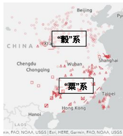
図4「アワ(植物)」(SUZUKI 2023) 注：凡例表示は報告者による

(7)「アワ」を表す語は、植物名と脱穀後の実の呼称が区別される。植物としての「アワ」は、北方に“穀”系語形、南方に“粟”系語形が分布し、南北対立を示す。「アワ」の脱穀した実を表す語形は、北方に“米”系語形、南方に“粟”系語形が分布し、やはり南北対立を示す。これらの語では、植生とも関わって長江付近が異なる系統の語形の境界となっていることが明らかになった(図4)。