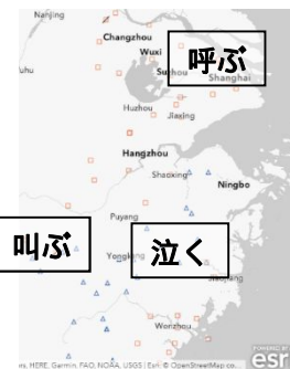
図3 “叫”の意味 (鈴木(未刊))

(5)「(人を)呼ぶ」を表す語形は、標準中国語でも使用される“叫”・“喊”が大勢を占め、広域地図では漢語方言全体に分布する。これらの語形は多くの方言で同時に「叫ぶ(shout)」という意味をも表す。“叫”は「(動物が)鳴く」という意味で用いられる語形でもあり、さらに「(人間、特に子どもが)泣く」という意味で用いられる方言が見られる。ただし、“叫”の意味に着目して分布地図を作成すると、「(人を)呼ぶ」を表す“叫”と、「(子どもが)泣く」を表す“叫”の分布地域はほとんど重複することがなく、補い合うような分布を示すことが注意される(図3)。語形分布地図の分析により、「発音器官で比較的大きな音を出す」という共通点をもつ、「呼ぶ」「叫ぶ」「(動物が)鳴く」;「(人間が)泣く」という一連の意味領域を表す語形が、相互に関連しながら分布することが明らかになった。